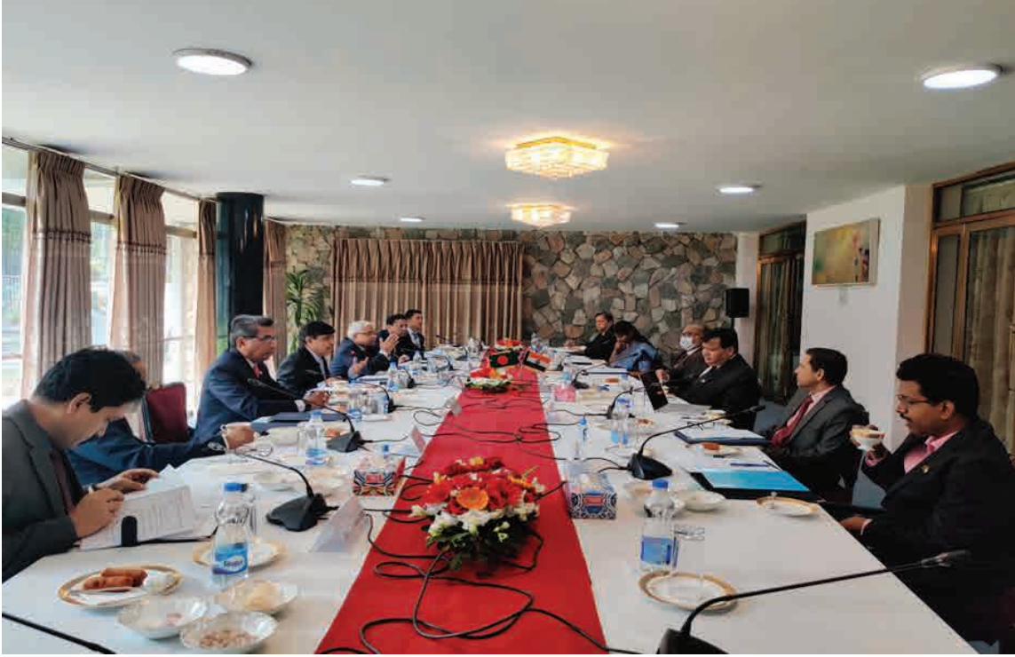
২৫ নভেম্বর, ২০২১ তারিখ ঢাকায় অনুষ্ঠিত গঙ্গা নদীর পানি বন্টন সংশ্লিষ্ট বাংলাদেশ-ভারত যৌথ কমিটির ৭৬ তম বৈঠক।