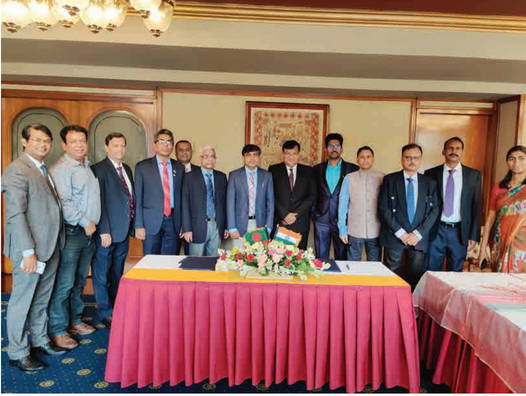
১৯ মে, ২০২২ তারিখ ঢাকায় অনুষ্ঠিত গঙ্গা নদীর পানি বন্টন সংশ্লিষ্ট বাংলাদেশ-ভারত যৌথ কমিটির ৭৮তম বৈঠক।