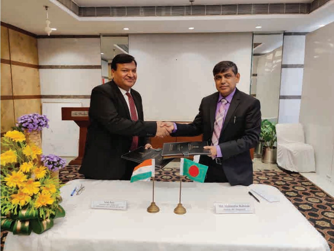
১৪ এপ্রিল, ২০২২ তারিখ ভারতের কোলকাতায় অনুষ্ঠিত গঙ্গা নদীর পানি বন্টন সংশ্লিষ্ট বাংলাদেশ-ভারত যৌথ কমিটির ৭৭তম বৈঠক।